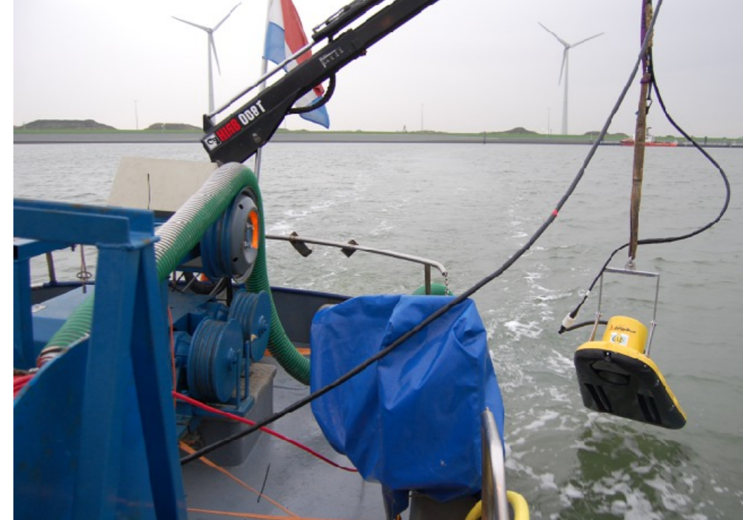
Meetsystemen aan boord van de Havenschap 1 van Groningen Seaports, tijdens waterbodemonderzoek in de Eemshaven. In de groene slang bevindt zich de Medusa-detector; buiten boord de gele meetvis van het Subbottom profiler systeem (chirper).

In het kader van grootschalige zandwinning op de Noordzee voert Deltas onderzoek uit naar de mogelijke gevolgen van het opwerpen van slib tijdens baggerwerkzaamheden op de Noordzee. Eén van de onzekerheden bij dit onderzoek is het vermogen van de waterbodem om als buffer voor fijn slib te fungeren. Om inzicht te krijgen in dit bufferend vermogen, is een monitoringscampagne opgestart waarmee de variatie in het slibgehalte over een jaar wordt gemeten. Hierbij worden zowel metingen gedaan van het slibgehalte in de waterkolom (zwevend slib) als metingen aan de waterbodem. De absolute slibgehalten zijn echter zeer laag. De gehalten aan slib liggen tussen de 1 en 5%. Deze gehalten liggen tegen